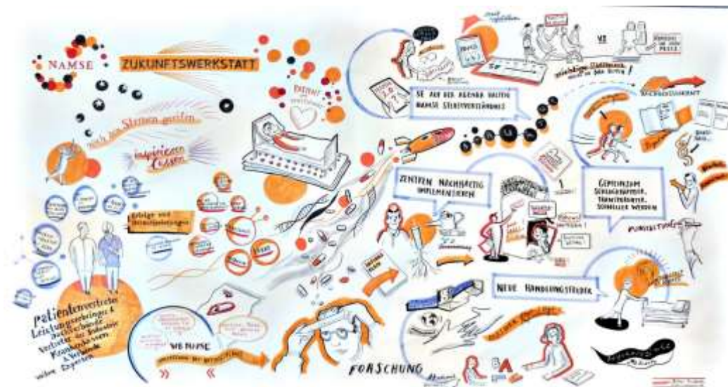
„Wie soll die Zukunft von NAMSE aussehen?“ In Open-Space-Workshops wurden Ideen für eine gemeinsame Strategie erarbeitet. Ein Ergebnisprotokoll in Bildern.