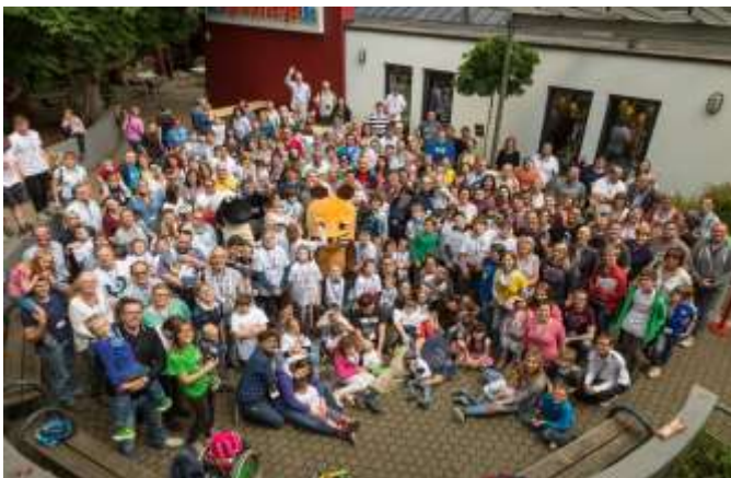
Gruppentreffen CHARGE Syndrom e.V.

Vom 16. – 19. Juni 2016 drehte sich in der Jugendherberge Oberwesel am Rhein alles nur um das CHARGE-Syndrom. Den Auftakt machte eine Fachkräftetagung, die 110 Teilnehmer besuchten. 74 CHARGE-Betroffene und ihre Familien (insgesamt fast 400 Teilnehmer) aus Deutschland, Frankreich,